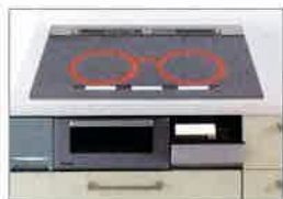
ビルトイン自動調理対応コンロ 12,000pt