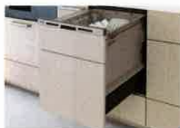
ビルトイン食器洗い乾燥機 18,000pt