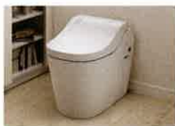
掃除しやすいトイレ 18,000pt